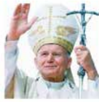
Jan Pavel II. 1978-2005