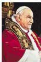
Jan XXIII. 1958-1963