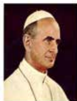
Pavel VI. 1963-1978