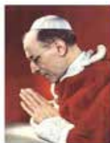
Pius XII. 1939-1963

Vteřiny minuly, ale obrazovka televize pořád ukazuje na komín ze Sixtinské kaple. Čeká se, kdy se kouř konečně vybarví. Kdyby tak člověk věděl, co se děje za tlustými zdmi Sixtinské kaple, kde kardinálové volí papeže. Zástupy lidí dole nevidí, že probíhá další kolo volby. Uvnitř kaple při čtení jmen hlasovacích lístků je nápadně často slyšet jméno Jorge Maria Bergoglio. Bude to asi Španěl, nebo Ital, nebo to může být někdo z daleka, z druhého konce světa, to by bylo něco!! Teď právě počet hlasitě jmenovaného Bergoglio překročil dvě třetiny z celkového počtu, takže Bergoglio je zvolen! A kouř bude bílý! Kardinál ale pro pořádek čte dále, až vyčerpá veškerý počet jmen. Mezi čteními, tam v posledních řadách shromážděných kardinálů, se ke skromně sedícímu kar-