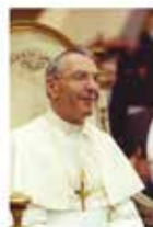
Jan Pavel I. 1978-1978