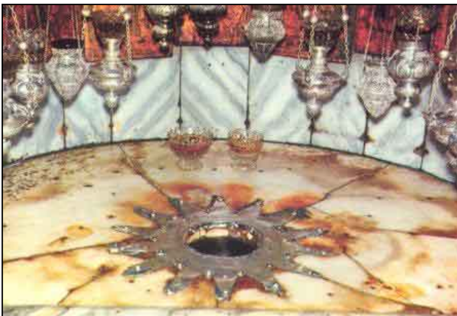
Betlém - místo Kristova narození

Jiný obraz nabízí v předvánočním čase Betlém. Jen 14 km vzdálené městečko od Jeruzaléma vítá poklidně svými prosluněnými svahy tisíce poutníků a turistů, kteří se mohou pokochat malebnou okolní krajinou, jež dosud nese pečeť Kristových dob. O teroristické akce však není nouze. Intifáda (povstání palestinských Arabů)